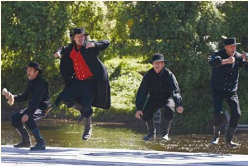
En minä hurjan luontoni tähäre päätäni alaha paina. Iloonen ja irti maasta meinaan aina olla.